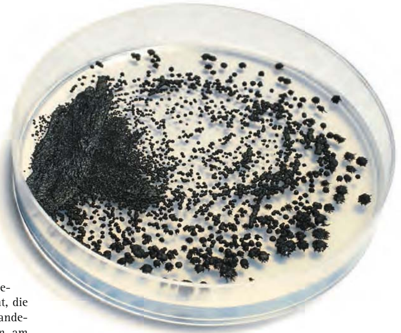
Spezielle Farben halten Fertigungshallen – vor allem in der Lebensmittelindustrie – schimmelfrei.

Millionen Euro in Forschung und Entwicklung, um Kunden und Partnern innovative Produkte und Lösungen anbieten zu können. Eine wichtige Rolle spielt dabei das Projekthaus Composites (Verbundwerkstoffe). Es ist die zehnte Einrichtung dieser Art. In dem Forschungshaus sollen neue Materialien und Systemlösungen für den Leichtbausektor entwickelt werden – vornehmlich für Anwendungen in der