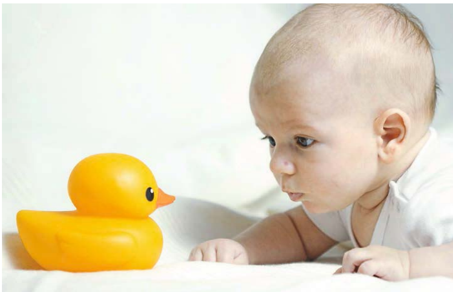
Für die gesundheitsschädlichen Weichmacher z. B. in Kinderspielzeug werden ungefährliche Alternativen entwickelt.

Zu den Branchenkönnern, die lieber im Verborgenen blühen, gehört zweifellos auch Bioni System in Oberhausen-Buschhausen: Ein Technologieführer im Kampf gegen Schimmelpilze und Bakterien, dessen Produkte vor allem von der Lebensmittelindustrie weltweit nachgefragt werden. Denn durch diverse Produktionsverfahren, aber auch durch die ständige intensive Reinigung der Maschinen und Bänder ist